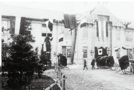
桐生高等染織学校